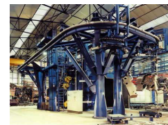
GRANLHADORAS DE CARGA SUSPensa