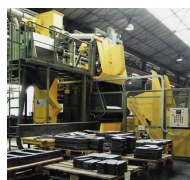
GRANLHADORAS DE TAMBOR COM CINTA METÁLICA