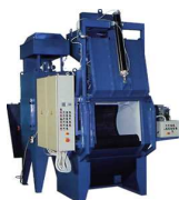
GRANLHADORAS DE TAMBOR COM CINTA DE BORRACHA