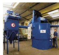
GRANLHADORAS DE MESA ROTATIVA